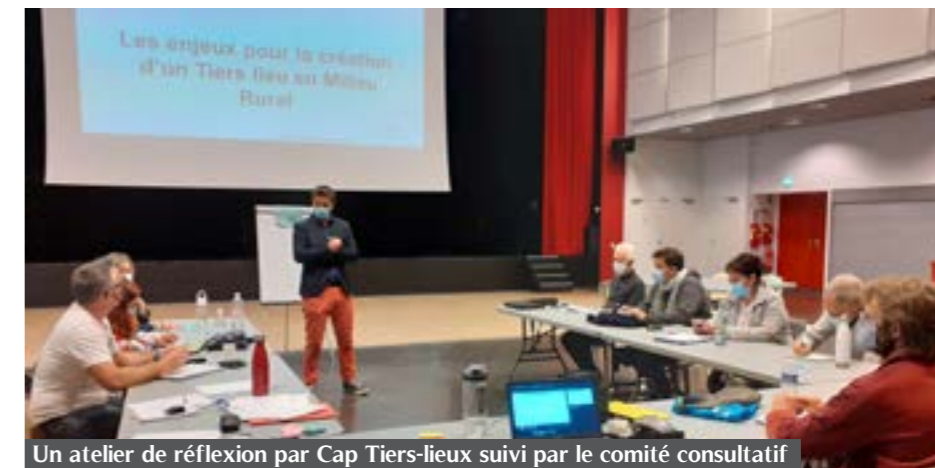
Un atelier de réflexion par Cap Tiers-lieux suivi par le comité consultatif

Dessiner le futur lieu, c'est partir d'une page blanche pour imaginer des activités et des espaces inventifs où se croisent