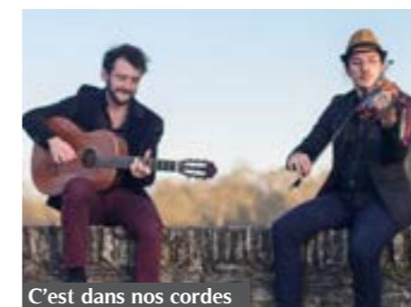
C'est dans nos cordes