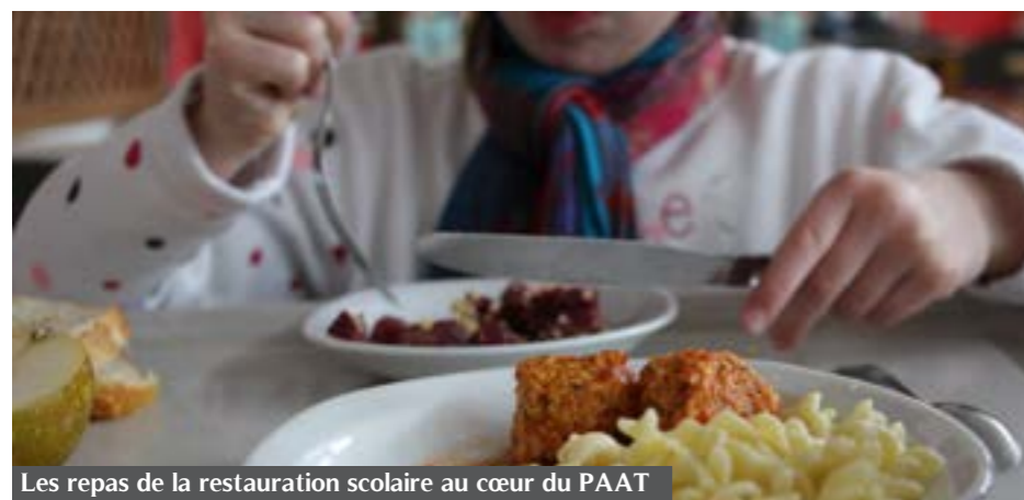
Les repas de la restauration scolaire au cœur du PAAT

Lors du Conseil municipal du 20 avril, les élus ont voté favorablement pour répondre à la demande de subvention pour l'élaboration d'un Projet Agricole et Alimentaire de Territoire (PAAT) et ainsi valider la participation à l'appel à projets du Programme National pour l'Alimentation.