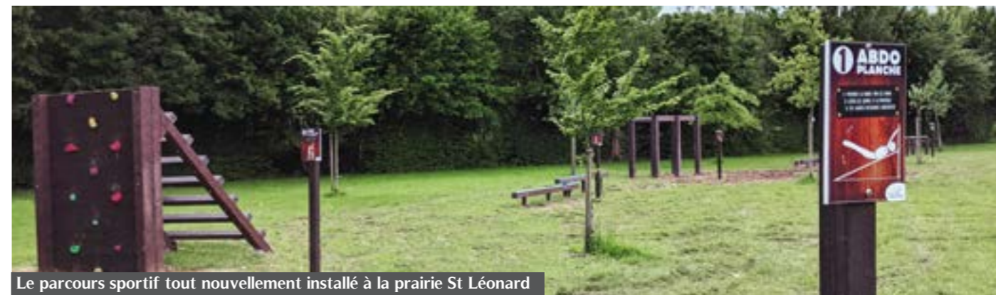
Le parcours sportif tout nouvellement installé à la prairie St Léonard