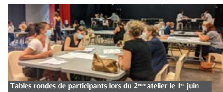
Tables rondes de participants lors du 2 ème atelier le 1 er juin

Troisième rendez-vous citoyen du projet participatif de territoire de Demain Durtal, le 2 juillet ! Les habitants, les collégiens et l'équipe municipale vont se réunir au théâtre des Balades du Temps Jadis pour un 3 ème atelier citoyen. L'objectif : sélectionner une liste de projets parmi les propositions citoyennes à remettre à l'équipe municipale ce jour-là. Cet avis citoyen va lui permettre de mettre en place une feuille de route des projets (alimentation, santé, logement, commerce, culture, déplacement).