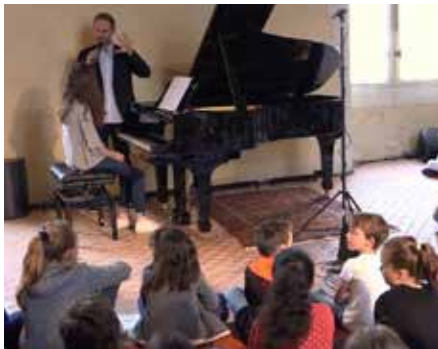
Les élèves se sont montrés très attentifs lors de la Master Class

Du jeudi 29 juin au dimanche 2 juillet Festival de Musique de Durtal