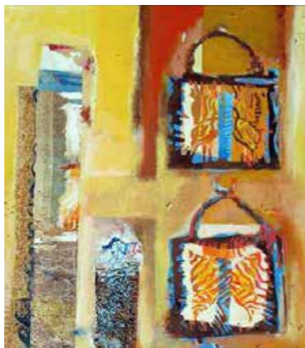
les œuvres artistiques d'Ali Silem seront présentées du 20 au 23 octobre

A l'occasion de ses portes ouvertes, l'association Les Arts à la Campagne accueillera les 21 et 22 octobre une exposition de tableaux du peintre Ali Silem.