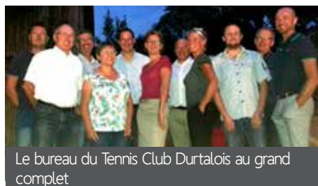
Le bureau du Tennis Club Durtalois au grand complet

Les membres du Tennis Club Durtalois sont heureux de vous présenter leur saison 2017-2018. Après le traditionnel tournoi de septembre, drainant des compétiteurs et compétitrices du Maine