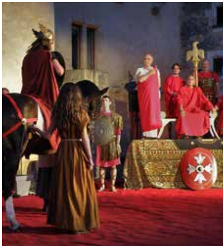
César ordonne à Vercingétorix de rendre les armes.