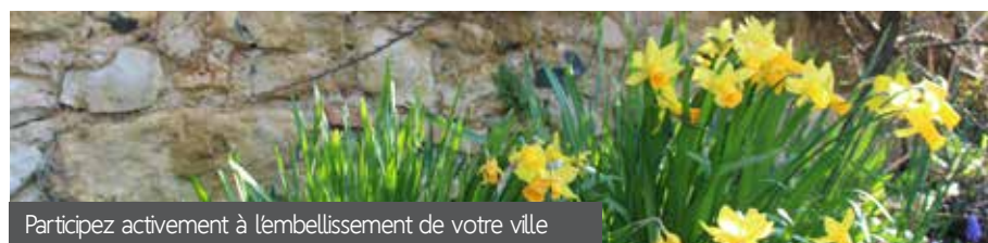
Participez activement à l'embellissement de votre ville

Au vu du succès de la 1 ère opération, la ville propose pour la 2 ème année consécutive, à tous les foyers de bénéficier gracieusement d'un sachet de semences permettant la mise en place de prairie fleurie ou de fleurissement de pieds de mur.