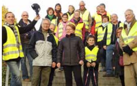
Le comité de jumelage vous prépare une belle Durtal Nacht

Après le succès de son édition 2016, le Comité de Jumelage organise la 2 ème RANDO-BALADE familiale semi-nocturne dans et autour de Durtal, samedi 21 octobre.