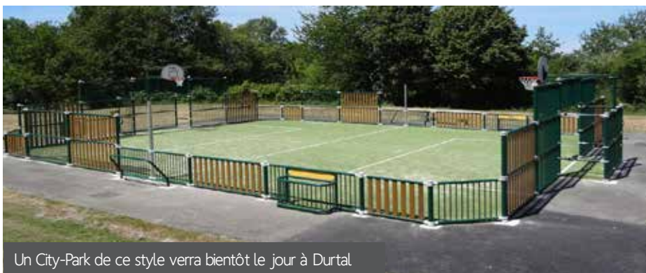
Un City-Park de ce style verra bientôt le jour à Durtal.