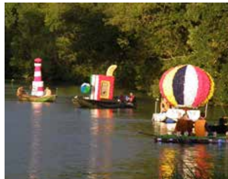
Pas de 20 000 lieues sous les mers pour les bateaux de la Fête du Loir

Samedi 22 juillet, 29 ème édition de la Fête du Loir, des milliers de spectateurs se pressent pour applaudir les bateaux de Camille Claudel/ Jothuère, Saint Léonard, Amicale des Sapeurs-pompiers, Gouis et l'APE René Rondreux qui avaient tous rivalisé d'imagination pour mettre Jules Verne à la fête.