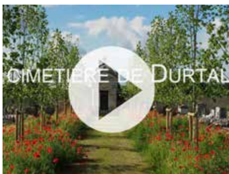
La vidéo est à retrouver sur la page Youtube de la ville

Le cimetière de Durtal est même devenu un exemple pour les communes et communautés de communes avoisinantes qui doivent elles-aussi passer au Zéro Phyto.