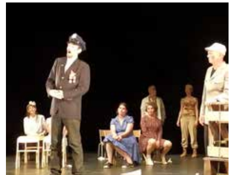
Les stagiaires n'ont pas hésité à donner de la voix.

Samedi 26 et dimanche 27 août Festival Angevin d'Opéra Bouffe